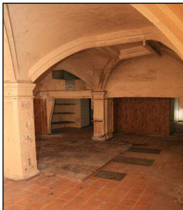
Anciennes cuisines au sous-sol