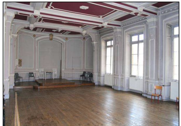
La « Chapelle »