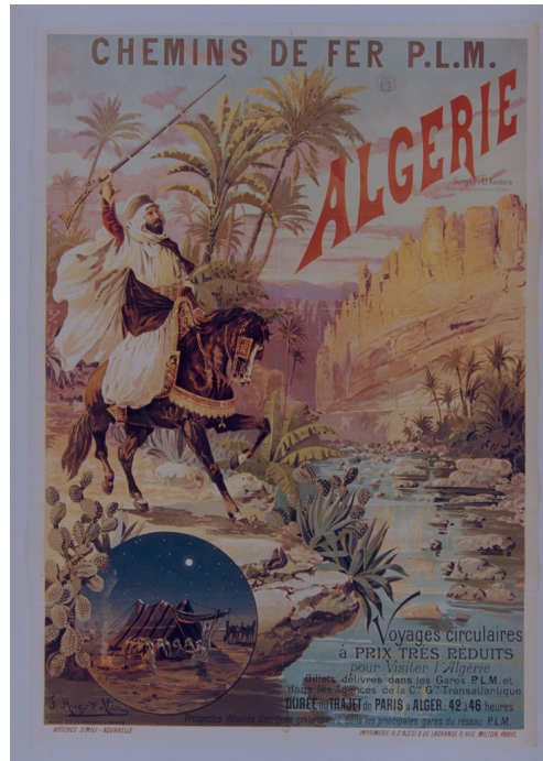
Algérie, chemins de fer PLM : Hugo d'Alesi Collection des Silos maison du livre et de l'affiche de Chaumont

A l'occasion du 7ème salon du livre de Chaumont, un concours littéraire a été organisé à l'attention des adultes de plus de 16 ans, destiné à récompenser les auteurs d'un texte sur le thème « Au cœur du désert... »