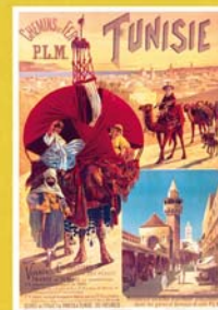
Tunisie, chemins de fer PLM : Hugo d'Alesi