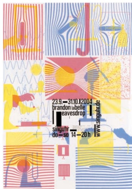
SINGHUR, Cyan, 2004, Allemagne