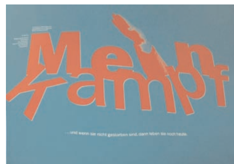
MEIN KAMPF, Friedler Grindler, 1992, Allemagne (1)