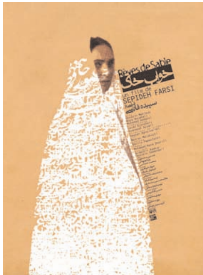
Rêve de sable , 2003, affiche de film

Cinema haqiqat , 2002, affiche pour un magazine, sérigraphie