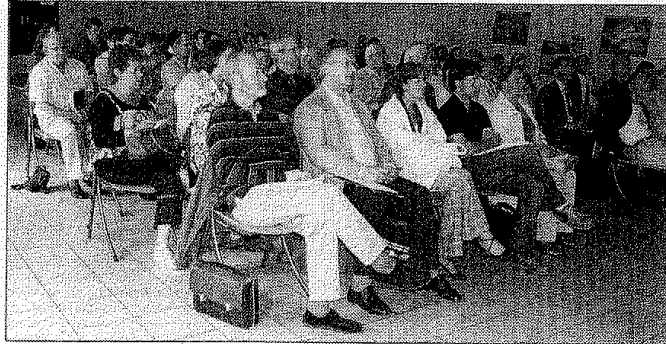
Les acteurs socioprofessionnels et les représentants du monde associatif sont venus nombreux pour assister à cette première réunion.

Avant cela, d'autres rencontres seront organisées en direction de la population. «Cet été, nous