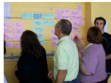
Tableau récapitulatif des 11 enjeux prioritaires :