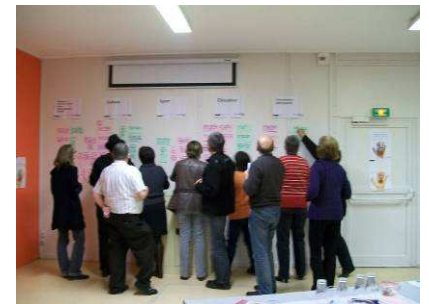
Tableau récapitulatif des 11 enjeux prioritaires :