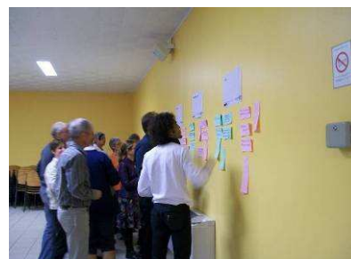
Tableau récapitulatif des 10 enjeux prioritaires :